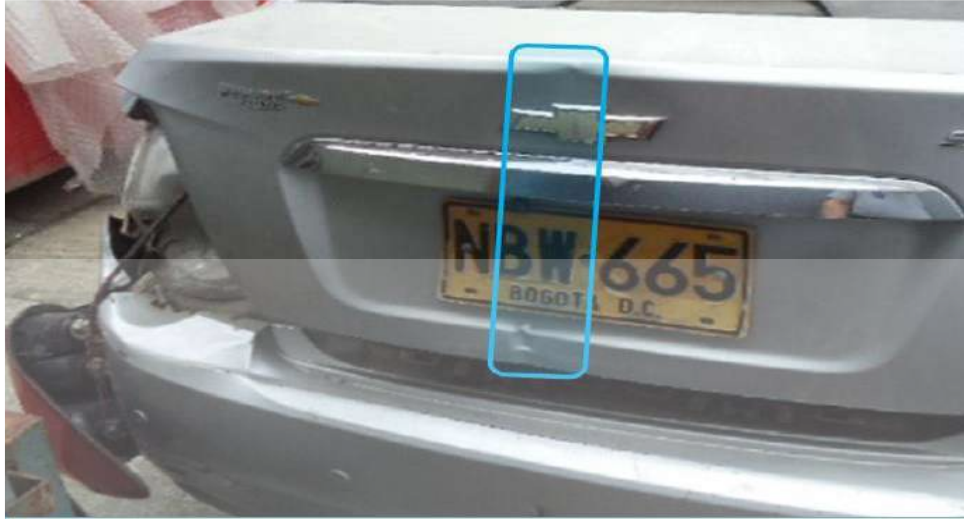
Posible orientación de elemento fijo contra el que se da el impacto